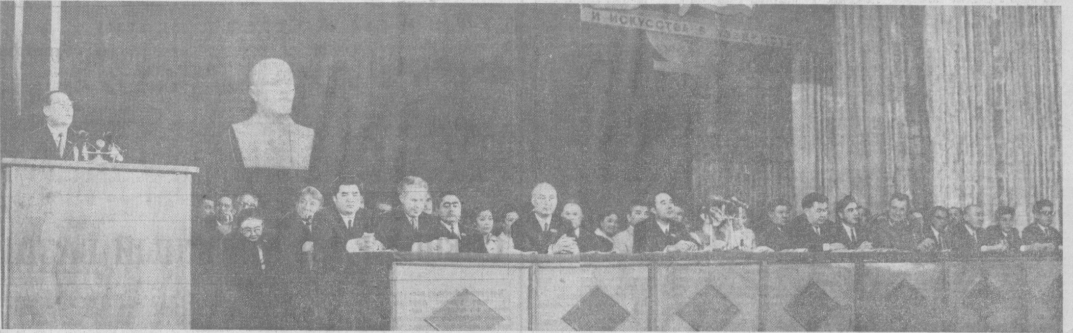
Ташкент, 28 сентября. Торжественное открытие декады казахской литературы и искусства в Узбекистане. На трибуне — Председатель Совета Министров Казахской ССР Б. А. Ашимов. Фото И. ДУШКИНА и Р. ШАМУТДИНОВА. (УзТАГ).

ОРГАН ТАШКЕНТСКОГО ГОРКОМА КП УЗБЕКИСТАНА И ТАШГОРСОВЕТА