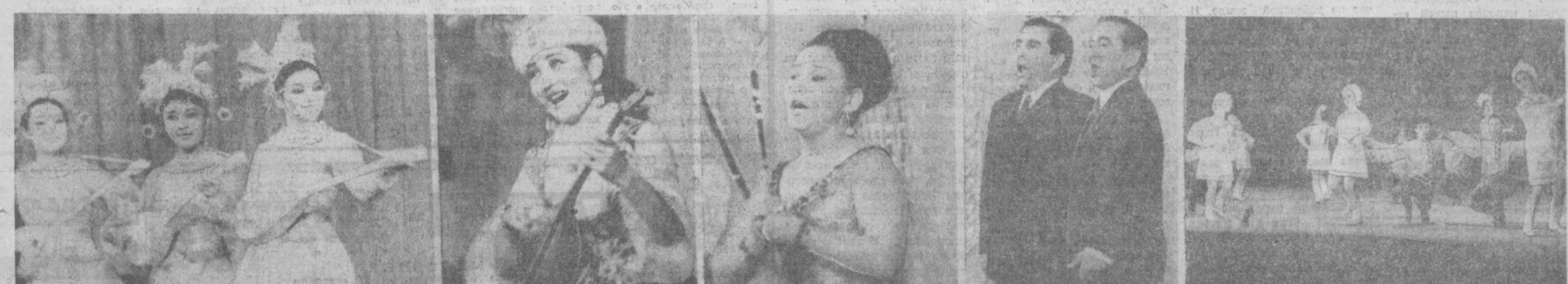
НА СНИМКАХ: слева направо — «Танец домбыристов» исполняют артисты молодежного ансамбля «Гульдер»; поэт-солист молодежного ансамбля Н. Айдаулетова; казахскую песню привезла на узбекскую сцену народная артистка Советского Союза лауреат Государственной премии СССР Бибигуль Тулегенова; дуэт братьев — народного артиста СССР Ришата и народного артиста Казахской ССР Муслима Абдуллинных; узбекский зритель награждает аплодисментами за русский танец артистов заслуженного коллектива республики — ансамбля песни и танца Казахской ССР.