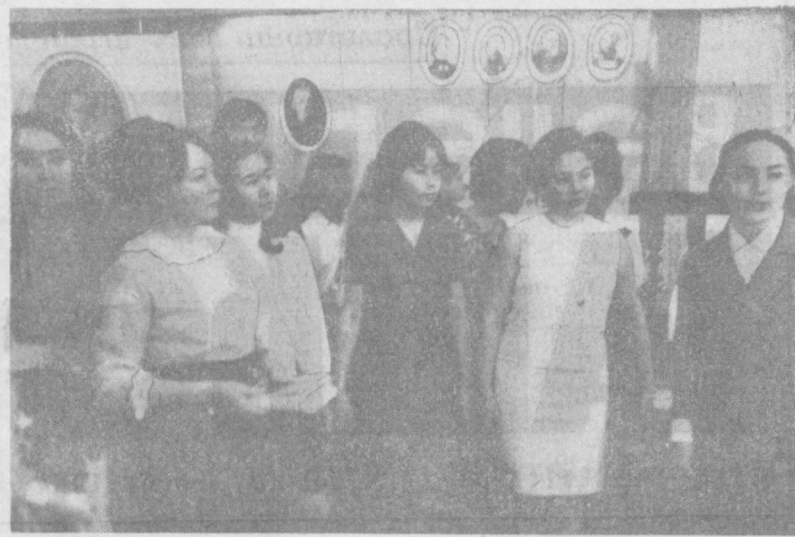
НА СНИМКЕ: ГРУППА УЧАСТНИКОВ ДЕКАДЫ КАЗАХСКОЙ ЛИТЕРАТУРЫ И ИСКУССТВА В УЗБЕКИСТАНЕ ЗНАКОМТСЯ С ЭКСПОНАТАМИ ФИЛИАЛА Ц.Н.ЛЕНИНА.