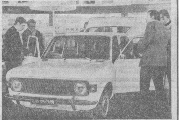
СФРЮ. Автомашины «Застава», выпускаемые заводом «Црвена Застава» в Крагуеваце, очень популярны в стране. Первый автомобиль «шпили» с конвейера в 1933 году. После завершения модернизации и реконструкции завода в 1973 году его производительность достигнет 180 тысяч машин.

«Нью-Йорк таймс» в корреспонденции из Белграда называет советско-югославское заявление «историческим документом». Переговоры между Л. И. Брежневым и И. Тито, отмечает «Нью-Йорк таймс», «заложили основу» для дальнейшего улучшения и развития советско-югославских отношений.