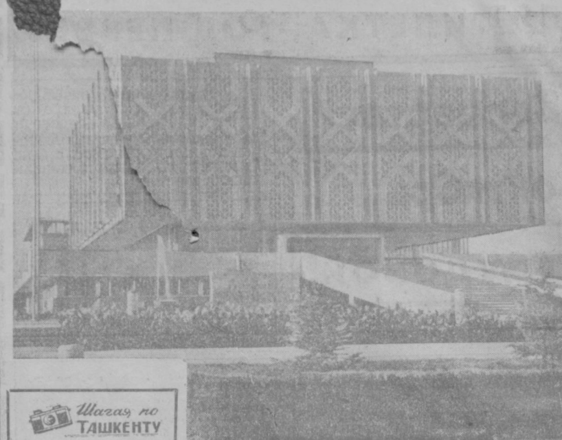
Улицы в Ташкенте

Бюро горкома партии рекомендовало партийным организациям улучшить политическую и воспитательную работу в общежитиях, шире привлекать для воспитания молодых строителей коммунистов и хозяйственных руководителей, регулярно организовывать для молодежи лекции и беседы по воспитанию у нее чувства гордости за свою профессию.