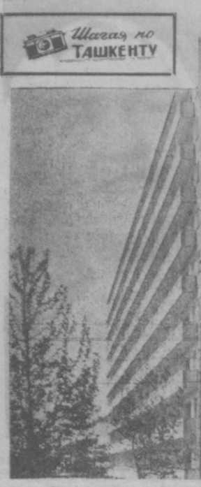
НА СНИМКЕ: новый многоквартирный жилой дом на улице Катаргал.