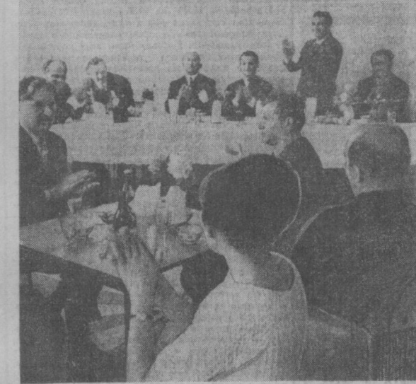
Ташкентский транзитный завод. За «круглым столом» идет дружеская беседа заводчан с участниками декады — артистами Государственной хоральной капеллы.