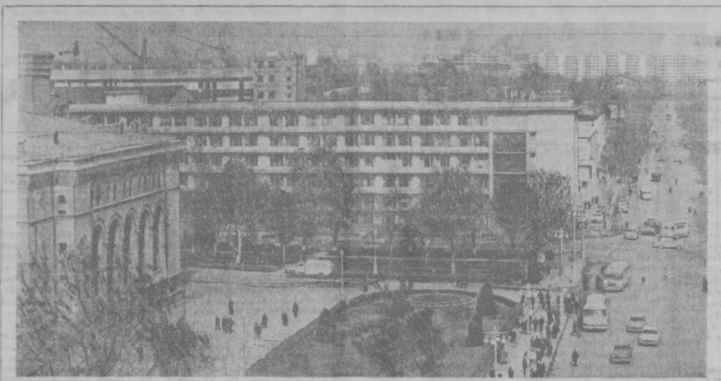
Шагай по Ташкенту