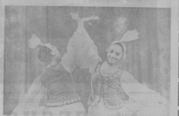
Выступают солисты молодежного эстрадного ансамбля «Гульдер».

...А сегодня снова был аэропорт. Последние взмахи рук — и себрытные точки разворвались в небо. До свидания, декада! Спасибо тебе за теплое слово, крылатую песню, добрую шутку. До свидания, друзья! До новых встреч!