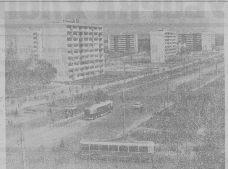
Неузнаваемо изменилась за последние годы столица Узбекистана. Незнакомными стали ее улицы, площади, кварталы. НА СНИМКЕ: вид проспекта имени Алишера Навои.

В этом году в лесхозе в порядке эксперимента заложено несколько питомников с новыми породами декоративных деревьев. Впервые полукратная деланка засеяна семенами восточной туи. Хороший подарок получил лесхоз от ташкентских лесоводов — десять килограммов семян сосны. Осенью они будут поселены еще в одном питомнике.