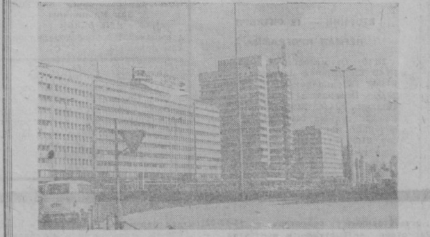
ГДР. Замечательные новостройки украшают столицу республики. Лучшей визитной карточкой социалистического градостроительства стал центр Берлина, реконструированный за последние годы. НА СНИМКЕ: административные и жилые здания в Берлине.

Советский Союз прислал на фестиваль две картины — «Король Лир» и «Начало».