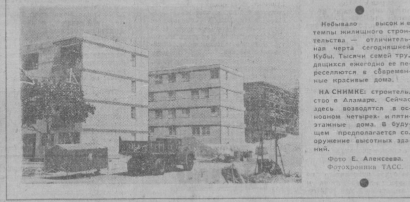
Небывало высоки и темпы жилищного строительства — отличительная черта сегодняшней Кубы. Тысячи семей трудятся ежегодно ее переселются в современные красивые дома.

СОФИЯ. В столице Болгарии создан научно-исследовательский институт по проблемам социалистической экономической интеграции. Его основная задача — конкретная разработка важнейших задач, связанных с участием республики в хозяйственном и научно-техническом сотрудничестве социалистических стран. В институте шесть специализированных секций — общих проблем интеграции, международной специализации, совместной плановой деятельности государств дружества, то-