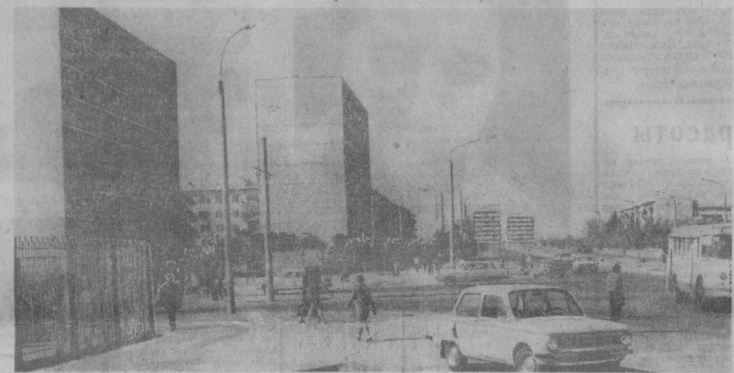
Намного расширила свои границы за последние годы столица Узбекистана. В тех местах, которые еще совсем недавно считались пригородом и где находились загородные лагеря, сейчас стоят высокие жилые дома. Один из таких уголков запечатлел наш фотокорреспондент М. Нуритдинов. НА СНИМКЕ: вид на 23-й квартал.