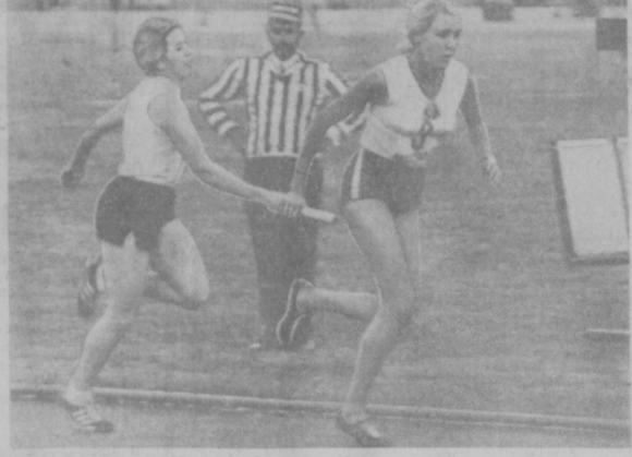
Эстафетная палочка передана. Вперед, к финишу.

на рисунках: В. Гринченко в ролих венсеньдлера из оперы Б. Зейдмана «Русские люди» и в роли короля Филиппа II в опере Д. Верди «Дон Карлос». Худ. Н. Меламед.