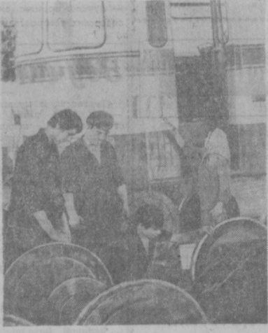
Трамвайное депо № 2 — одно из передовых предприятий трамвайно-троллейбусного управления города. Здесь своевременно осуществляется плано-предупредительный и текущий ремонт трамвайных поездов.

Рост потребности в электроэнергии потребовал новых, более мощных электростанций. Нескоро вышло головное сооружение канала Салар построена ТашГЭС, примерно в 500 раз мощнее «гидры». На ТашГЭС вода Бозсу не