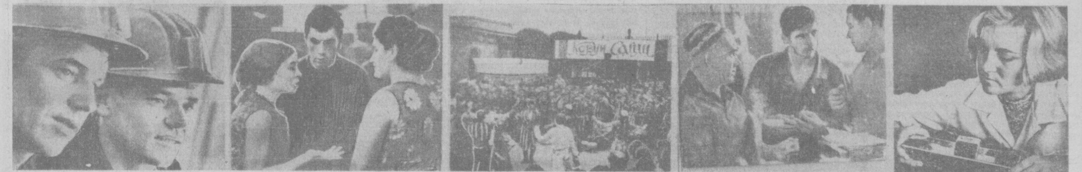
В честь форума журналистов в большом фойе зала заседаний Совета Министров Узбекской ССР открылась республиканская выставка художественной и документальной фотографии «Решения XXIV съезда КПСС — в жизнь». НА СНИМКАХ: фоторепродукция с выставки.