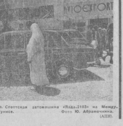
Тунисская Республика. Советская автомашина «Лада-2103» на Международной ярмарке в Тунисе.

В первых матчах XXX чемпионата страны по хоккею с шайбой «Спартак» и «Динамо» сыграли 0:2, ЦСКА и «Крылья Советов» — 0:3.