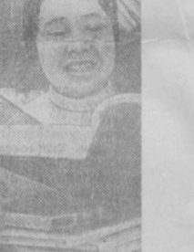
Восемь тысяч читателей республиканской научнотехнической библиотеки Узбекского государственного университета технической информации. Сейчас здесь насчитывается более миллиона экземпляров научно-технической литературы, журналов, наглядных пособий и словарей. Услугами библиотеки пользуются студенты технических вузов, аспиранты, научные работники, рабочие.