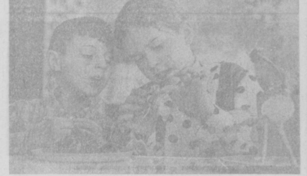
«РАСШИРИТЬ СЕТЬ ДЕТСКИХ УЧРЕЖДЕНИЙ, ПОСТРОИТЬ ЗА ПЯТИЛЕТИЕ ЗА СЧЕТ ГОСУДАРСТВА ДОШКОЛЬНЫЕ УЧРЕЖДЕНИЯ БОЛЕЕ ЧЕМ НА ДВА МИЛЛИОНА МЕСТ...» (Из Директивы XXIV съезда КПСС).

ПО ДАННЫМ всесоюзной переписи населения, в Латвии сейчас проживает менее ста ливов, чем предки в XI—XII веках обитали вдоль побережья Рижского залива, в низовьях Даугавы, на берегах Гауи. Вся территория современной Латвии и Эстонии в далеком прошлом называлась Ливонией. История некогда многочисленного народа отражена в древних письменных источниках. Ливы занимались земледелием и скотоводством, рыболовством и бортничеством, вели оживленную торговлю со Скандинавией, островом Готланд и русскими городами. Они приняли на себя первые удары немецких крестоносцев, двинувших свои полчища на Прибалтику. Кроваво-лихие войны XIII столетия, эпидемия чумы резко сократили численность ливов, они подвергались также усильной ассимиляции в среде соседних народов. Современные ливы — последние из могикан — проживают в латвийских городах и рыбацких поселках. Это колхозники, учителя, рабочие, служащие. Некоторые из них знают язык предков, помнят обычаи, танцы, песни и сказания. С. ШПУНГИН. Рига.