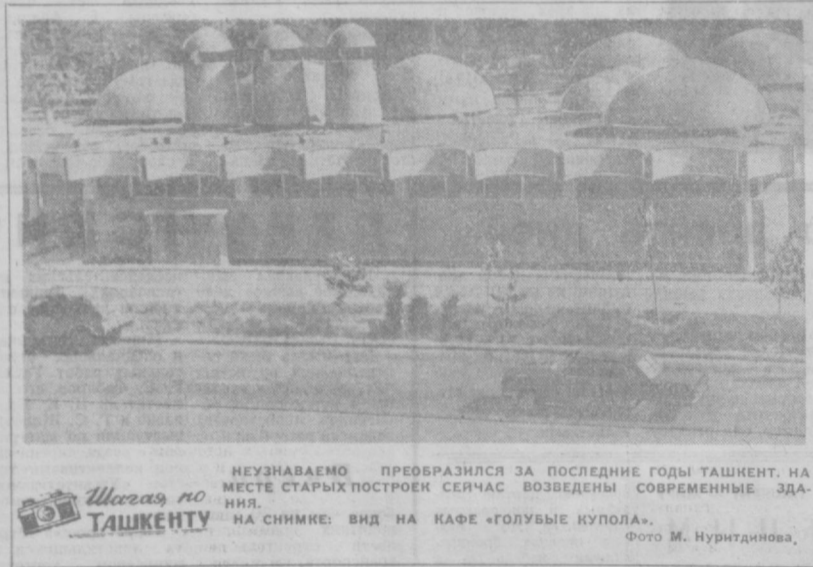
НЕУЗНАВАЕМО ПРЕОБРАЗИЛСЯ ЗА ПОСЛЕДНИЕ ГОДЫ ТАШКЕНТ. НА МЕСТЕ СТАРЫХ ПОСТРОЕК СЕЙЧАС ВОЗВЕДЕНЫ СОВРЕМЕННЫЕ ЗДАНИЯ. НА СНИМКЕ: ВИД НА КАФЕ «ГОЛУБЫЕ КУПОЛА».

К СЖАЛЕНИЮ, такой высокой и устойчивый темп сумели удержать не все коллективы предприятий. Промышленность Сергелиевского района выполнила план реализации продукции только на 99,5 процента. К снижению районных показателей привела неустойчивая работа карьера нерудных материалов и специализированной промышленной базы. Они остались в большом долгу перед государством. Если бы оба эти предприятия справились с планами, район в целом смог бы значительно перекрыть девятимесячное задание по реализации продукции. Большим мог быть и вклад всей промышленности города: 28 предприятий не справились с девятимесячным планом, недодали продукции на 5,7 миллиона рублей. В денежном выражении этот долг перекрывает хорошо работающими предприятиями, но от этого значение потерянному никак не снижается. В числе отстающих — также крупные предприятия, как «Узбексельмаш» и экскаваторный завод, заводы железобетонных изделий №№ 5 и 9, комбинат панельного домостроения № 3, на долю которого приходится почти