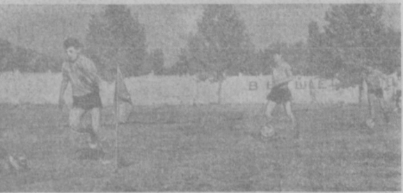
Футболисты отрабатывают технику ведения мяча.

ГЛАВНЫЙ РЕКОРД—ЗДОРОВЬЕ НА СПОРТБАЗАХ ИНСТРУМЕНТАЛЬНОГО ЗАВОДА ЗАНИМАЕТСЯ ОКОЛО 350 РАБОЧИХ. ДВЕСТИ ИЗ НИХ ИМЕЮТ РАЗРЯДЫ В РЯДАХ СПОРТСМЕНОВ СЕМЬ МАСТЕРОВ СПОРТА СССР *ИЗ ЗАВОДСКОЙ СЕКЦИИ—В ЧЕМПИОНЫ МИРА