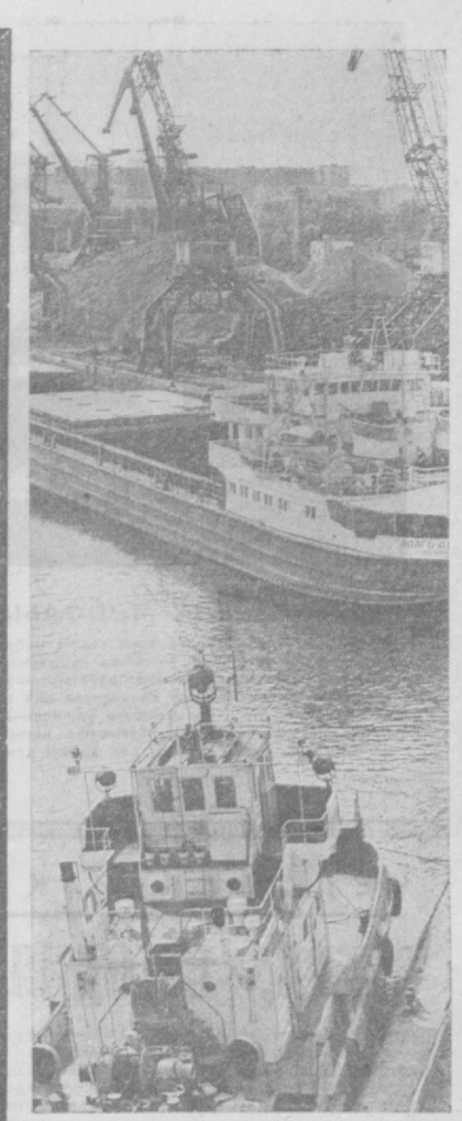
МОСКВА. Успешно трудятся столичные речники в завершающем году девятой пятилетки. Четыре крупных участка Западного порта уже завершили пятилетнее задание.

Дочь выросла, закончила техникум, теперь здесь же, в Геофизике, в библиотеке работает. В доме мир и согласие. Порядок, чистота. «Муж у меня насчет этого