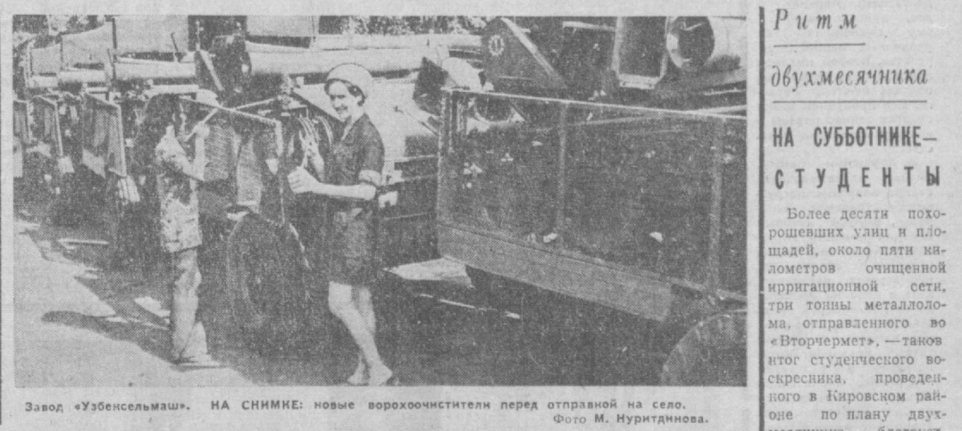
Завод «Узбексельмаш». НА СНИМКЕ: новые ворохоочистители перед отправкой на село.

та народного контроля по проверке исполнения решений партийных и советских органов. 3. Сообщения депутатов городского Совета о выполнении ими депутатских обязанностей, поручения Совета и его органов. Председатель исполкома Ташгорсовета В. КАЗИМОВ. Секретарь исполкома Ташгорсовета М. МАРТЬЯНОВА.