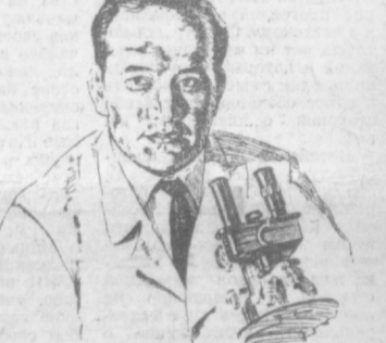
«В ДРУЖБЕ НАША СИЛА, НАШЕ СЧАСТЬЕ»