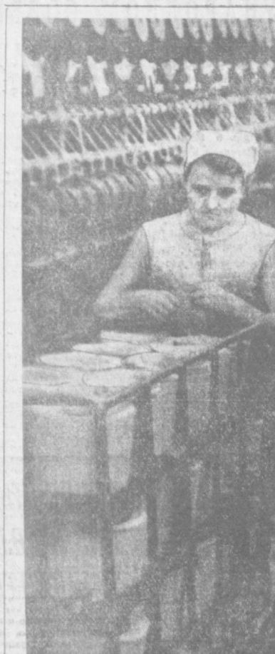
Ташкентская меховая фабрика. НА СНИМКЕ: идет транспортная готовая продукция — меховая шуба.