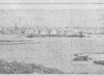
На острове Кюрасао, входящем в группу Антильских островов в Карибском море, принадлежащих Нидерландам, объявлено чрезвычайное положение. Более трехсот голландских морских пехотинцев с полным боевым снаряжением брошены рабочими нефтяными, бальнеологическими заводами голландской компании «Ройял датч шелл», рабочих-машинистами фирмы «Карибизин» вер-