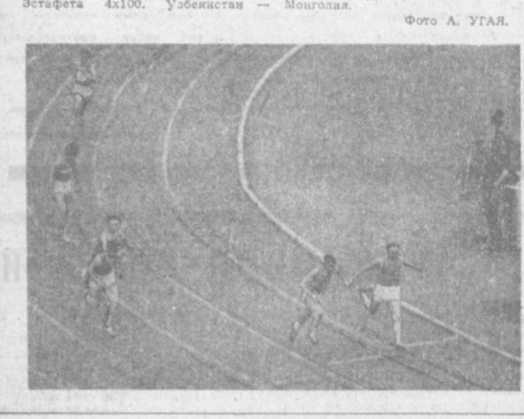
Эстафета 4x100. Узбекистан — Монголия.

В Узбекистане прошла VI спартакиада профсоюзов. Одним из увлекательных мероприятий в Ташкенте были соревнования по боксу. В течение четырех дней упорные бои, как в личном, так и в командном зачете.