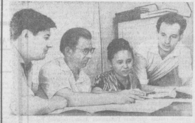
ПРАЗДНИК В СЫРДАРЬЕ

торов производства и передовых коллективов, информировать читателей о работах изобретателей и рационализаторов, заводских лабораторий и конструкторских бюро, сообщать о новинках отечественной и зарубежной науки и техники, о внедрении научной организации труда, комплексной механизации в автоматизации производства и управлении. Газета будет знакомить читателей с важнейшими событиями в нашей стране и за рубежом, со строительством новой жизни в странах социализма, с борьбой трудящихся капиталистических стран за свои политические и социальные права. В газете будут публиковаться очерки, рассказы, отрывки из произведений советских и зарубежных писателей, посвященных жизни рабочего класса. Предусмотрены специальные разделы фельетонов, сатиры и юмора. Газета будет выходить на четырех полосах формата «Правды» шесть раз в неделю. Подписная цена на год — 6 руб. 24 коп., на 6 месяцев — 3 руб. 12 коп.