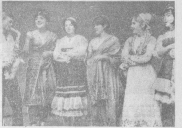
Этот вокальный ансамбль, созданный при Доме культуры имени А. Хидоятова в городе-спутнике Сергиев, носит поэтическое название «Радуга». Коллектив самодеятельности пользуется у зрителя большой популярностью.

НА СНИМКЕ: группа участников вокального ансамбля «Радуга».