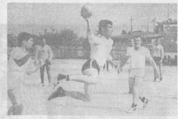
На площадках спортклуба «Старт» прошли состязания по ручному мячу в программе VI спартакиады Узовпрофа.

В 1914 году проводился один из первых международных футбольных матчей между командами Самарканда и Ташкента. Это были официальные состязания, которые привлекли огромное количество зрителей.