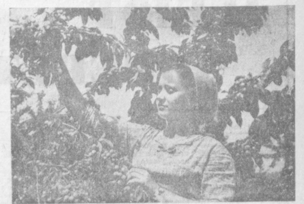
В садах Ирма поспела черешня.

десят девятого года. Подпись начальника... — Ясно! — спросил мой друг. — Вместо подписи клиента — подпись начальника. Значит, он-то хорошо знает, что из химчистки вещи выходят с пороком! Поэтому и стоимость работы не указана. — Ну, успокойся, старина! Вспомни о каком-нибудь забавном случае из своей жизни, разрейся! — Вспомнил! Очень забавный случай! Понимаешь, к брисукам пришла бумажка! Очень смешно! — Что же тут смешного! — А как же! На бумажке написано: «Платна вытравлены». И стоит подпись инженера. Разве не смешно! Я промолчал в знак согласия. И подумал о том, что пороками страдают не только вещи. Кайтмас ТОШКАНДИ.