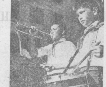
НА СНИМКАХ: так отдыхают ребята в лагере при школе № 181.