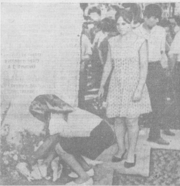
Встреча в ЦК Компартии Узбекистана

О большой любви узбекского народа и созданию пушкинского гения, о влиянии его творчества на развитие культуры и литературы народов нашей страны, в том числе и узбекского, говорили рабочий ла-