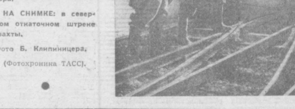
Начата добыча угля на новой шахте № 3 восточно-батуринского треста «Еманьелинскуголь» Челябинской области.

НА СНИМКАХ: в северном откаточном штреке шахты.