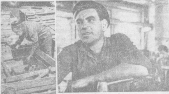
Растет число передовиков производства на заводе «Ташхимсельмаш». Многие рабочие взяли на себя обязательство — личную пятилетку завершить за четыре года.