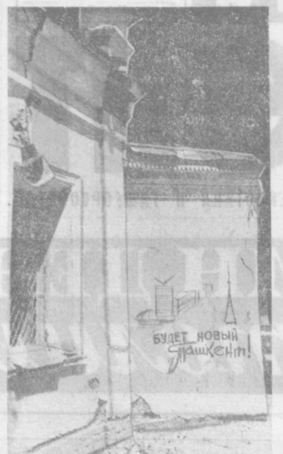
В Ташикенте появились много новых улиц, но, бесспорно, лучшей из них — это улица Дружбы народов, ибо она создана руками всех наших друзей, она — свидетель нашей крепкой спайки, братства.

Красочные, затейливые даши, в которых умельцы воспроизвели свой национальный орнамент, украшают «казахский» квартал. Сколько труда и старания приложили строители Ала-Аты к тому, чтобы яркая роспись радвала взор ташикенцев!