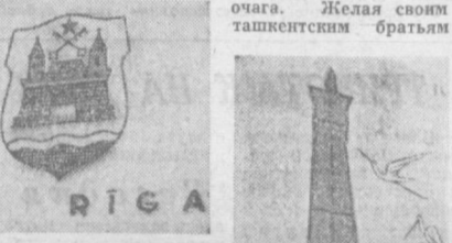
«Анг» — символ счастья и семейного очага. Желая своим ташикенским братьям

«В Ташикенте появилось много новых улиц, но, бесспорно, лучшей из них — это улица Дружбы народов, ибо она создана руками всех наших друзей, она — свидетель нашей крепкой спайки, братства. Ташикенцы никогда не забудут, как всколыхнулась, забеспокоилась вся страна, когда Горный энтанази, который помог в невиданно короткий срок построить по сути новый город, является народной эпопеей, которая войдет в мировую историю как замечательный пример дружбы и солидарности народов. М. КУЗОВЕНКО.