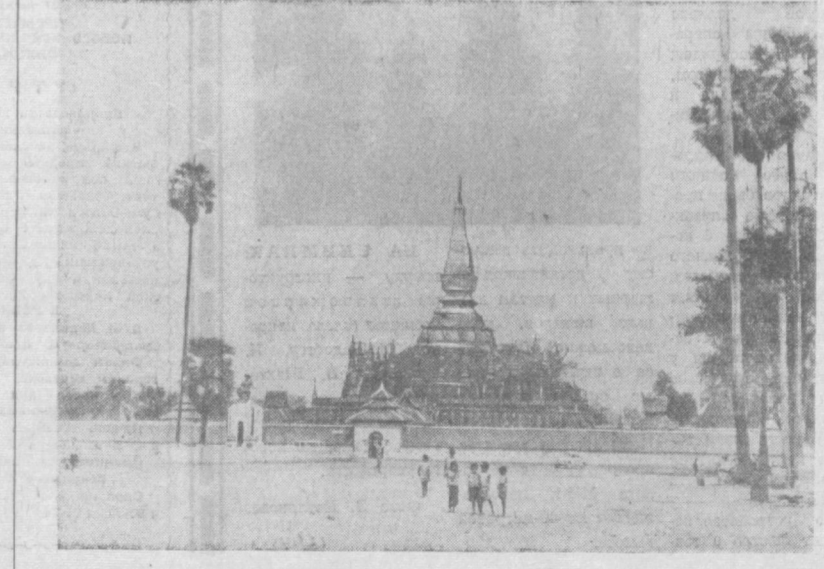
Лос издана славится древним архитектурным памятником. НА СНИМКЕ: храм Тхат Луанг во Вьетнаме, построенный в XVI веке.

замечает Ален Бук, — что солдаты, прибывающие сюда из Вьетнама прямо с передовых позиций, озабочены тем, чтобы в течение короткой разрядки строго соблюдать местные законы. Каждый год происходит тысячи инцидентов, но ни разу судья Окинавы не получил разрешения на разбор преступлений американских солдат, жертвами которых стали окинавцы». Огромная концентрация американского оружия на острове, отравление источников воды отходами горючего, непрекращающийся рев сверхзвуковых самолетов, и главное, непосредственная угроза уничтожения, если по какой-либо причине возникнет ядерный конфликт или просто произойдет несчастный случай, — все это вызывает гневные протесты жителей Окинавы, пишет корреспондент «Монд». Требования об уходе оккупантов становятся все более настойчивыми.