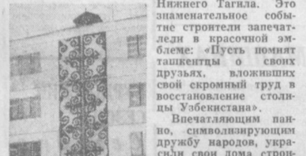
Нижнего Тагала. Это знаменательное событие строители запечатлели в красочной эмблеме: «Пусть помнят ташикенцы о своих друзьях, вложивших свой скромный труд в восстановление столицы Узбекистана».

Красочные, затейливые даши, в которых умельцы воспроизвели свой национальный орнамент, украшают «казахский» квартал. Сколько труда и старания приложили строители Ала-Аты к тому, чтобы яркая роспись радвала взор ташикенцев!