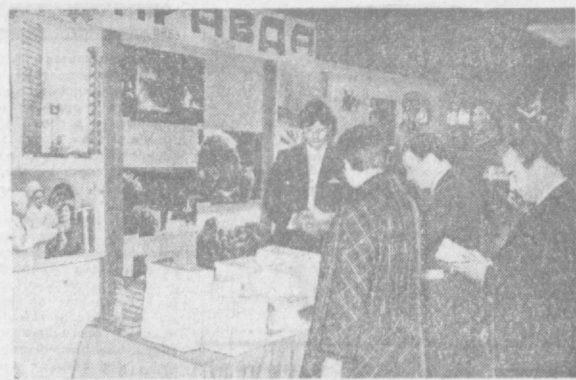
БРЮССЕЛЬ. Массовый праздник печатных органов бельгийских коммунистов — газет «Драпа руня» и «Роде ван» состоялся в городе Вавре. На праздник, проходивший на территории городского стадиона, пришли бельгийские трудящиеся, многие из которых являются распространителями газет, руководящими деятелями ИКП. НА СНИМКЕ: у стенда советской печати на празднике в городе Вавре.

КАИР. Здесь состоялось официальное открытие первого на африканском континенте бюро Всесоюзного объединения «Интурист». Оно призвано способствовать дальнейшему расширению туристских связей между СССР и ОАР. За последние годы обмен туристами между двумя странами принял широкий размах. Только в нынешнем году в ОАР побывало около 5 тысяч туристов из Советского Союза.