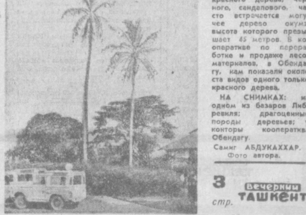
Десятки территории страны занимают самые драгоценные в мире породы деревьев, насчитывающиеся около трех тысяч видов. В джунглях Габона особенно много красного дерева, черного, сандалового, часто встречается мускусное дерево, высота которого превышает 45 метров. В кооперативе по переработке и продаже лесоматериалов, в Обединении, нам показали около ста видов одного только красного дерева.