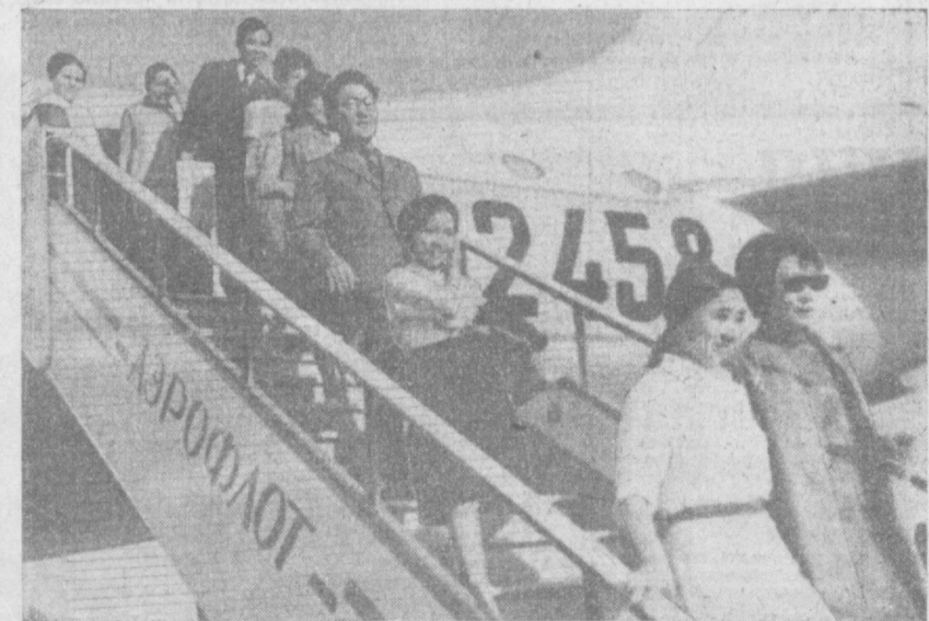
НА СНИМКАХ: теплая встреча монгольских друзей в Ташкентском аэропорту.