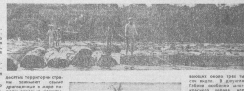
Десятки территории страны занимают самые драгоценные в мире породы деревьев, насчитывающиеся около трех тысяч видов. В джунглях Габона особенно много красного дерева, черного, сандалового, часто встречается мускусное дерево, высота которого превышает 45 метров. В кооперативе по переработке и продаже лесоматериалов, в Обединении, нам показали около ста видов одного только красного дерева.

Основное богатство страны — леса. Десятки