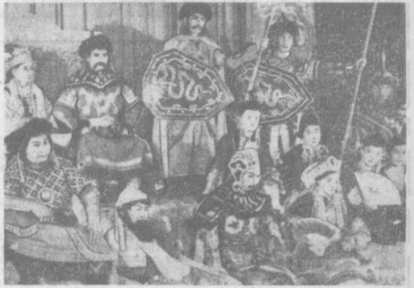
С большим успехом на сцене Улан-Баторского театра идет пьеса Д. Намдага «Три шарайгольских хана». НА СНИМКЕ: сцена из спектакля.