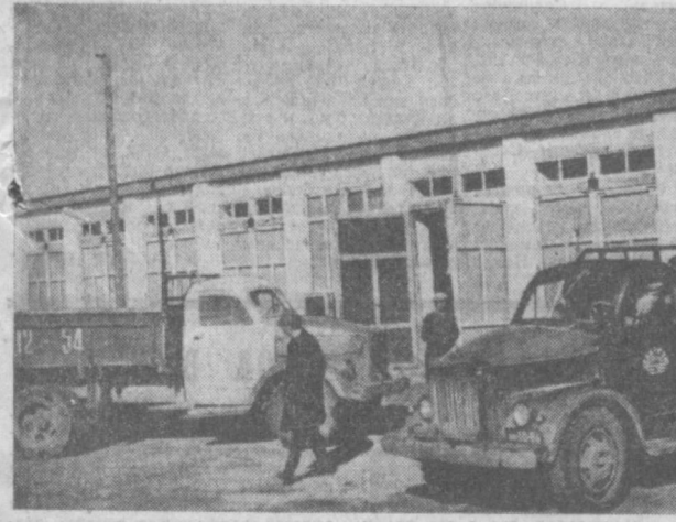
МНР. Сельхозобъединение «Светлый путь» Арахангантского аймака.

К широкой пропаганде итогов международного Совещания коммунистических и рабочих партий приступил Ташкентский Дом политического просвещения. По материалам Совещания организованы постоянные консультации. В плане — проведение лекций об интернациональной солидарности трудящихся СССР с народами социалистических стран, со всеми народами, борющимися за демократию, за мир и социализм. В помощь лекторам, политинформаторам и агитаторам оборудована специальная выставка. На ней представлены различные материалы всемирного форума коммунистов, трудящихся классов марксизма, ленинизма, брошюры, освещающие деятельность коммунистических и рабочих партий. Каждую же работу по пропаганде Московского Совещания начали во всех областях республики. (УзТАГ).