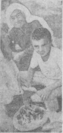
предмет постоянной заботы о них каждого члена нашего общества и — в первую очередь родителей, там

Дети наше будущее. За эти слова все полнота ответственности за судьбу каждого ребенка — родителей, школы, общественности. И там, где детям уделяется должное внимание, где они —