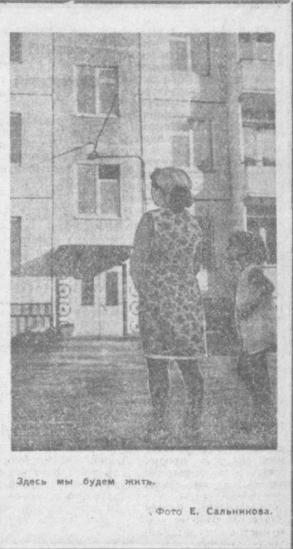
Здесь мы будем жить.