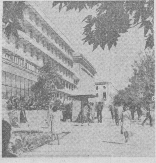
ТАШКЕНТ СЕГОДНЯ. Улица Навои.