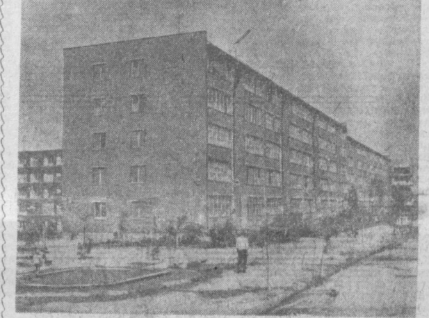
ТАШКЕНТ СЕГОДНЯ. Чиланзар. Дома, возведенные эстонскими строителями. Фото Э. Каминского.

▲ ВУДАПЕШТ. Подземный концентратный вал открылся в стальной пещере близ венгерского города Мишкольца. Сцена отделяется от зрительного зала подземной рекой Стикс. Эффектно подсвеченные статуи создают фантастическую картину. Специальность дает высокую оценку акустике грота. (ТАСС).