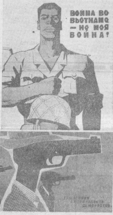
ВОЙНА ВО ВЬЕТНАМЕ — НЕ МОЯ ВОЙНА!

На фото: плакаты художников В. Евсеева, Г. Ткачева и Н. Леушина.