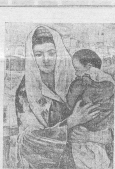
В. БУРМАКИН. «БАЯСУНСКАЯ МАДОННА».

К. ЛАВРЕНТЬЕВА , кандидат филологических наук.