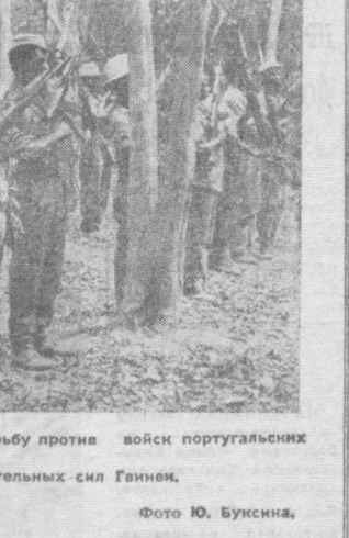
Народ Гвиней (Бисау) продолжает вести освободительную борьбу против войск португальских колонизаторов. НА СНИМКЕ: построение бойцов в одном из отрядов освободительных сил Гвиней.

самые решительные акции со стороны федерального суда. Этот расист в срочном порядке созвал пресс-конференцию. На ней Мэддокс обрушился на министерство юстиции, обвинив его в «коммунистических требованиях». Мы в Джорджии,