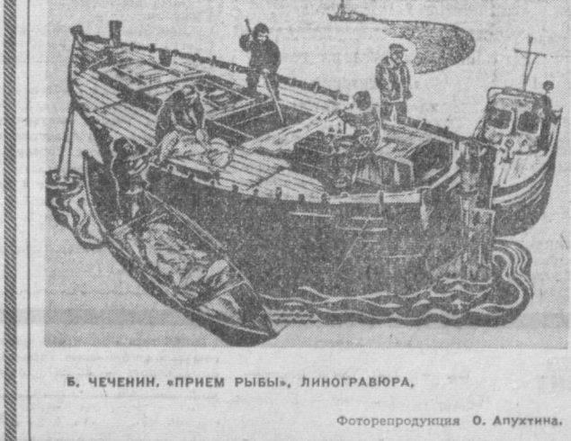
Б. ЧЕЧЕНИН. «ПРИЕМ РЫБЫ», ЛИНОГРАВИУРА.