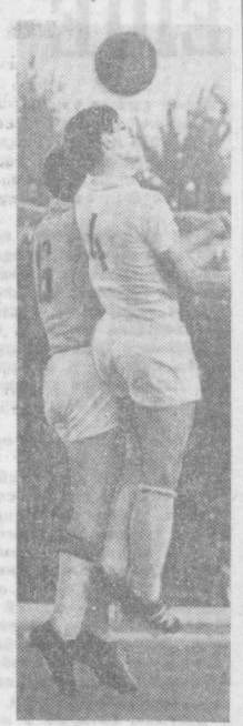
Вблизи штрафной...