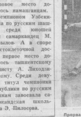
Прорвался...