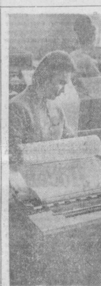
В Вычислительном центре Центрального статистического управления Узбекистана ведется обработка всей информации народного хозяйства республик. НА СНИМКЕ: в отделе технологии обработки информации на электронных и счетно-перфорационных машинах.