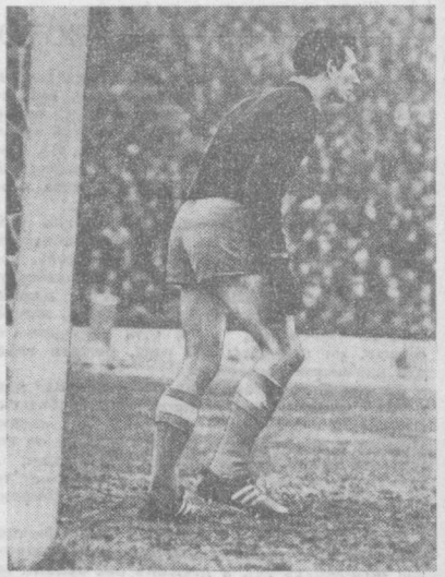
ВСЕГДА НАЧЕКУ...