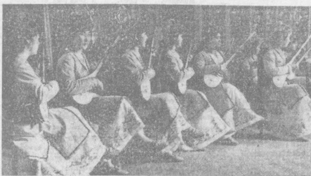
НА СНИМКЕ: караналпакский ансамбль дутаристов.

Декада узбекской литературы и искусства в Российской Федерации — это демонстрация больших успехов, достигнутых узбекским народом под руководством Коммунистической партии во всех сферах жизни, расцвета культуры узбекского народа, национальной по форме, социалистической по содержанию.