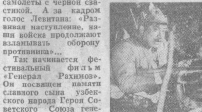
Фильм «Всадники революции» повествует о событиях, происходивших в Узбекистане в 1918—1920 годах, в годы установления и укрепления Советской власти в Средней Азии.

Сценаристы К. Икрамов, А. Макаров и режиссер А. Акбарходжаев представляют