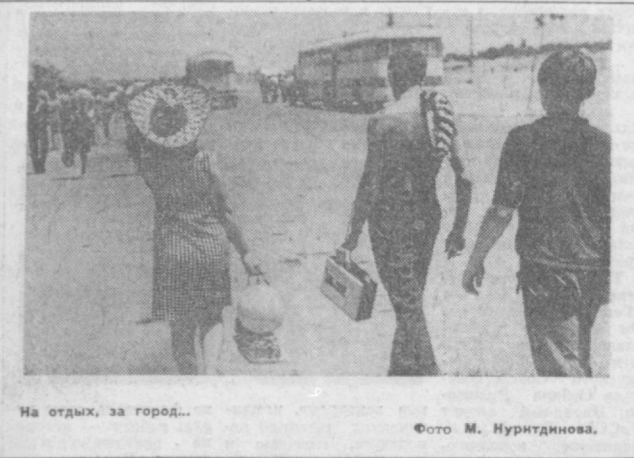
На отдых, за город...