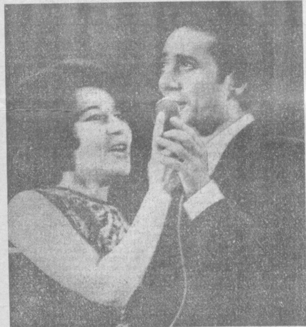
НА СНИМКЕ: поют популярные узбекские эстрадные певцы Луиза и Батыр Закировы.