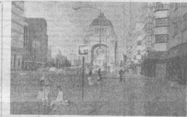
МЕХИКО. На рассвете появляются торговцы, газетами. Это в основном индейцы. НА СНИМКЕ: мать и сын с пачкой газет.

По мнению бразильских социологов, индейцев, которых в стране насчитывается сейчас от 50 до 100 тысяч, будут целиком уничтожены к 1980 году. За последние десятилетия у индейцев были отобраны скот и личное имущество на сумму около 62 миллионов долларов.