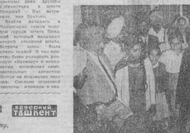
В. И. ЛЕНИН, ШАХУМАДОВ, КОТОРЫЙ ПРИНЯЛ участие в традиционных днях дружбы Убенистана в штате Пенджаб — На встрече, как братьев.

Э ТИ дни надого воспеваются в памяти жителей индийского города Патналя. — неитра штата Пенджаб, тысячи километров, высокие горы, глубокие реки отдают Убенистан от Индии. Но это не помеха дружбе, связывающей наши народы.