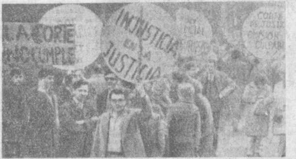
Вы видите манифестацию служащих учреждений. На одном из плакатов можно прочесть: «Несправедливость — в правосудии».