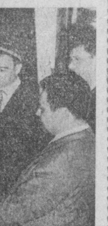
А. АУЛОВ, НА СНИМКЕ: встреча в Патнале.

готовится широко отметить знаменательную дату — столетие со дня рождения Владимира Ильича. Организируются специальные лекции на темы: «Ленин и национальный вопрос», «Ленин о культуре» и другие. Индигоские друзья с большим удовольствием восприняли сообщение, что в Ташиченском государственном университете открылось отделение, где будут готовить специалистов по языку пенджаби. А. АУЛОВ, НА СНИМКЕ: встреча в Патнале.