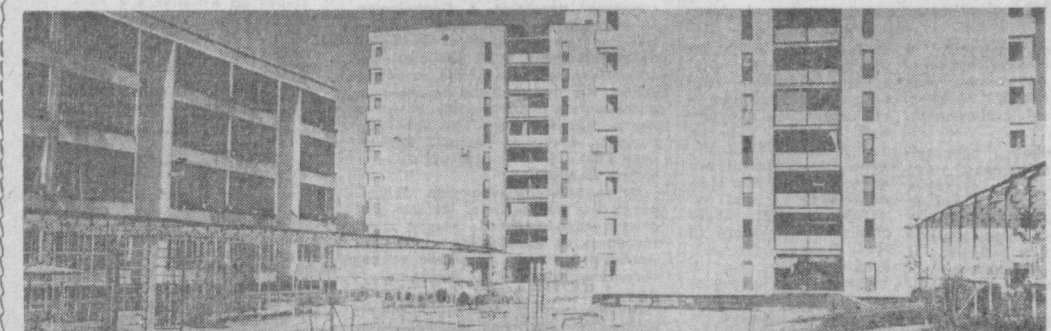
На месте бывшей Кашгарии. Дома, построенные горьковчанами.