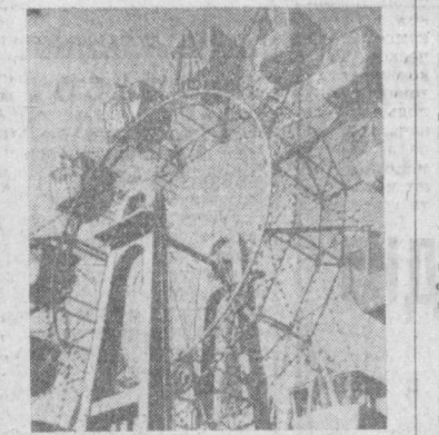
БОЛГАРИЯ, СОФИЯ. НА СНИМКЕ: уголок заводских игр в «Западном парке».

ПАГА. В 12 стран мира экспортирует продукция заводов имени Урски, расположенных в районе Острава. За последние годы здесь резко возросло производство химических продуктов для нужд народного хозяйства. Среди них — бензол, нафталин, бензин, масла и лаки, антикоррозийные покрытия для металлических изделий. По производству промышленных и строительных смол заводы имени Урски занимают одно из ведущих мест в мире. Почти четверть объема продукции этого объединения идет на экспорт. Перспективный план заводов имени Урски предусматривает дальнейшее интенсивное развитие производства.