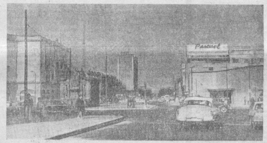
МЕХИКО. На улицах города.

ЛОНДОН. Бывший министр торговли Греции Кортис, проанализировав экономическое положение страны, заявил, что военная хунта ведет Грецию к хаосу. Этот анализ составлен им совместно с группой министров финансов и торговли и других финансовых специалистов, ведущих экономические дела Греции, из военного переворота 21 апреля 1967 года. Кортис указал, что внутренняя задолженность страны возросла на 800 процентов по сравнению с 1966 годом и что к концу нынешнего года дефицит платежного баланса достигнет 350 миллионов долларов. Нынешние обязательства греческого банка в иностранной валюте также возросли на 800 процентов по сравнению с обязательствами, предусмотренными в бюджете 1966 года.