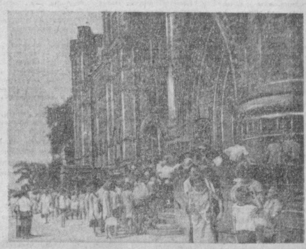
КАНАДА, ОТТАВА. На снимке: туристы у здания парламента Канады.