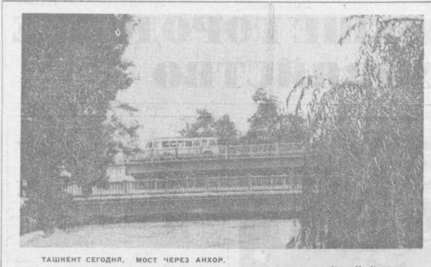
ТАШКЕНТ СЕГОДНЯ. МОСТ ЧЕРЕЗ АНХОР.