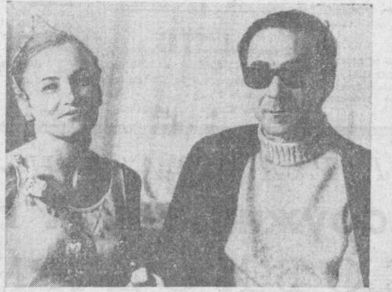
ПОЛЬША. На сцене Большого театра оперы и балета в Варшаве под руководством советского балетмейстера Алексея Чичинадзе осуществляется постановка балета С. С. Прокофьева «Золушка».