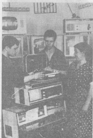
Пронатный пункт № 8 комбината «Шарк». Здесь жители массивов Высоковольтный и Черданцева могут взять напрокат нужные им предметы быта.

ДЛЯ ТАШКЕНТСКОГО МЕТРО 6 ГЕКТАРОВ ЦВЕТОВ