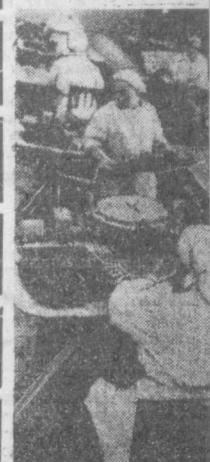
Кондитерская фабрика «Уртак». Автоматизированная линия по выработке кондитерских изделий.