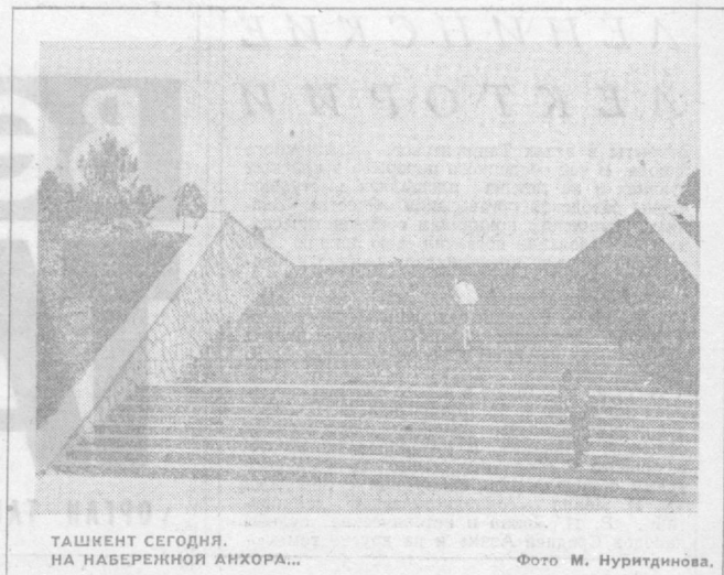
ТАШКЕНТ СЕГОДНЯ. НА НАБЕРЕЖНОЙ АНХОРА...