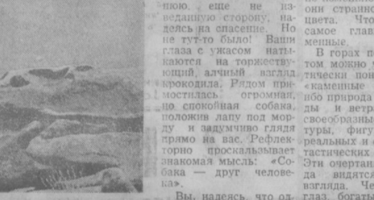
Вы, надеясь, что одна из собак окажется