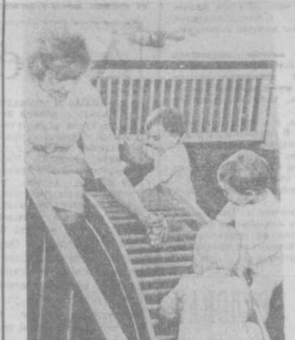
Если имена Антоны Безинова расположены в берлинском районе Па- нов. Это ведущее детское учреждение — столичный ГДР, в котором малы- шам обеспечен квалифи- цированный и заботливый уход. Но не менее важно значение приде- лают развитию и работ- но-устойчивости способ- ностей, воспитывая на- выки.

▲ ПАРИЖ. Штаб находящегося в Лон- доне объединенных ВМС НАТО в юж-