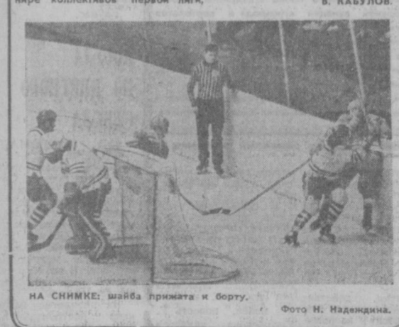
НА СНИМКЕ: шайба примата и борту.

в семь часов вечера в зал «Юбилейный», станут участниками памятного события. Все будет впервые. В первый раз капитаны хоккейных дружин поднимут в Ташкенте флаг соревнования чемпионов СССР. Кто-то из форвардов (а может, защитник) забьет первую официальную шайбу в ворота соперников. Кто-то первый откликнется на скамейке штрафников. Впервые наш «Спартак» (не московский) одержит победу (а может, потерпит первое поражение). Мы, болельщики, конечно же, будем радоваться успеху наших земляков. И не особенно гордиться, если их постигнет неудача: ведь впереди у команды большой спортивный путь, который сегодня только начинается.