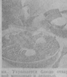
Украшается блюдо отварной морковью и зеленью.

отделить от костей и пропустить его вместе с хлебом, размоленным в молоке, через мясорубку, в фарш добавить соль и перец по вкусу. В перемешанный фарш кладут вареные целые яйца (2—4), все это смешивают и начиняют в шкуру, затем ее сшивают и варят на медленном огне до готовности. На гарнир фаршированной курицы подается маринованный виноград или маринованные яблоки. Все это поливается растопленным сливочным маслом. Украшается блюдо веточками петрушки и укропа. На пять порций надо взять: 700 г мяса, одно яйцо, 1/2 стакана молока.