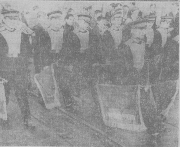
НА СНИМКАХ: В ПРАЗДНИЧНЫХ КОЛОННАХ.