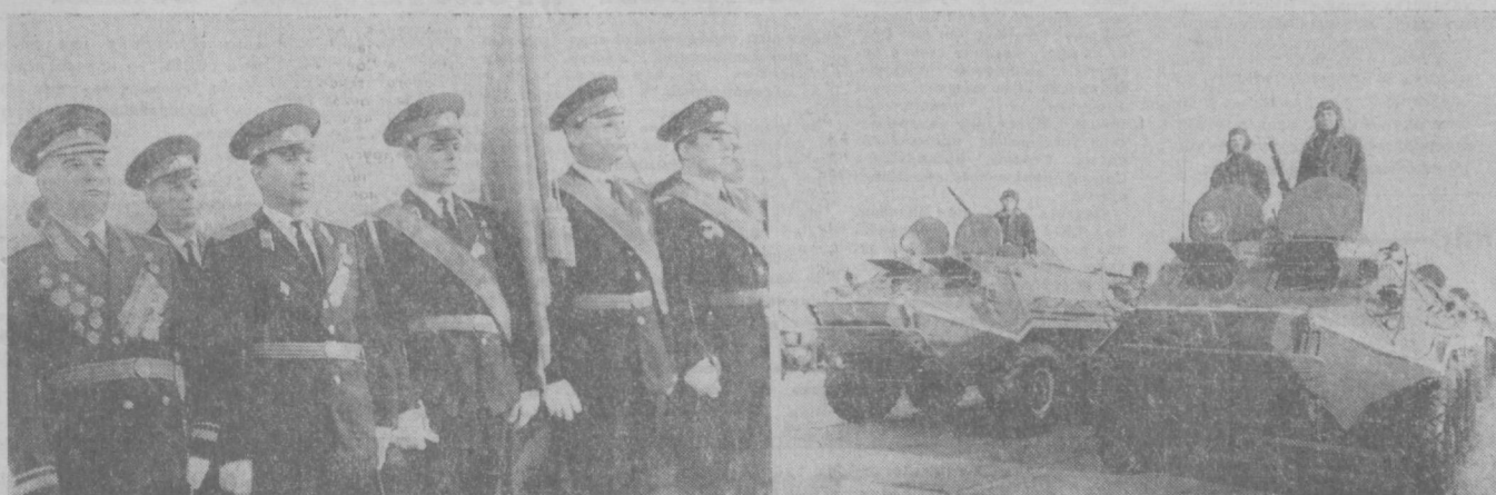
НА СНИМКАХ: ПАРАД ВОЙСК ТУРКЕСТАНСКОГО ВОЕННОГО ОКРУГА.