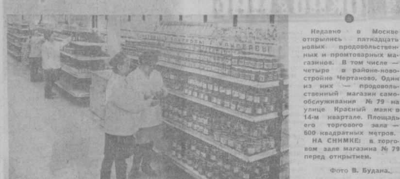
Недавно в Москве открылись пятнадцать новых продовольственных и промтоварных магазинов. В том числе — четыре в районе-новостройке Чертаново. Один из них — продовольственный магазин самообслуживания № 79 на улице Красный маяк в 14-м квартале. Площадь его торгового зала — 600 квадратных метров. НА СНИМКЕ — в торговом зале магазина № 79 перед откритием.

В ПОЧТОВОМ отделении № 53, что находится рядом с заводом «Узбексельмаш», обслуживание посетителей поставлено неудовлетворительно. 28 октября я пришел сюда, чтобы выпустить газеты и журналы на 1972 г. А мне ответили, что подписка закончена. После моих настоятельных просьб одна из сотрудниц сказала: — У нас нет кватитационных книжек. Поезжайте в 84-е отделение, и там вам вышлют... Плохо и то, что почта не всегда доставляется вовремя. Бывают случаи, когда газеты приходят сразу за два дня. Задерживалась доставка также денежных телеграфных переводов. В лесном углу этого здания, у входа, стоит более пяти лет специальная будка междугородных переговоров. Но она почему-то все это время бездействует. Г. БУЛГАКОВ.