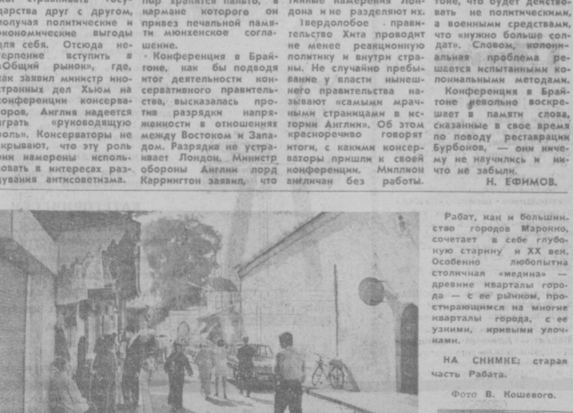
НА СНИМКЕ: старая часть Рабата.