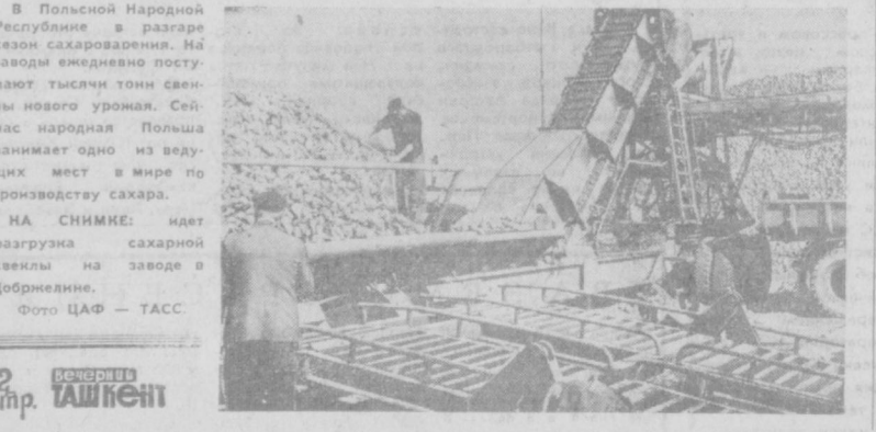
НА СНИМКЕ: чет разгрузка сахарной свеклы на заводе в Добрыне.

тыре девятки — 99,99 процента. Так ее и зарегистрировали на лондонской бирже. Теперь «Глогув» производит десятки тысяч тонн меди. В 1972 году, когда вступил в строй вторая очередь предприятия, оно будет выпускать 80 тысяч тонн высококачественной электротехнической меди. Б. БУЧКОВСКИЙ. Варшава.