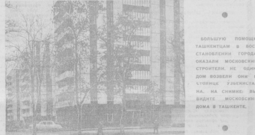
БОЛЬШУЮ ПОМОЩЬ ТАШКЕНТЦАМ В ВОССТАНОВЛЕНИИ ГОРОДА ОКАЗАЛИ МОСКОВСКИЕ СТРОИТЕЛИ. НЕ ОДИН ДОМ ВОЗВЕЛИ ОНИ В СТОЛИЦЕ УЗБЕКИСТАНА. НА СНИМКЕ: ВЫ ВИДИТЕ МОСКОВСКИЕ ДОМА В ТАШКЕНТЕ.