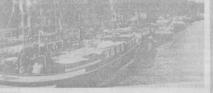
Этот снимок сделан в Амстердаме — столице Голландии. На знаменитых амстердамских каналах стоит на вечных якорях многочисленные «воиботы» — потемневшие от времени деревянные баржи. Это милицы бедноты, «дома» тех, для кого не нашлось места на берегу. По официальным данным, в Нидерландах насчитывается не менее 375 тысяч квартир-трущоб, совершенно непригодных для жилья и тем не менее заселенных людьми. Для обитателей «воиботов» недоступны даже и такие квартиры.

Ведет и усиленно влияния США на политическую, социальную и культурную области канады. В то же время, говорится в докладе, контроль американцев над канадской промышленностью привязывает Канаду к экономической политике США, ослабляет ее отношения с другими странами. Доклад Г. Грета отражает тревогу канадской