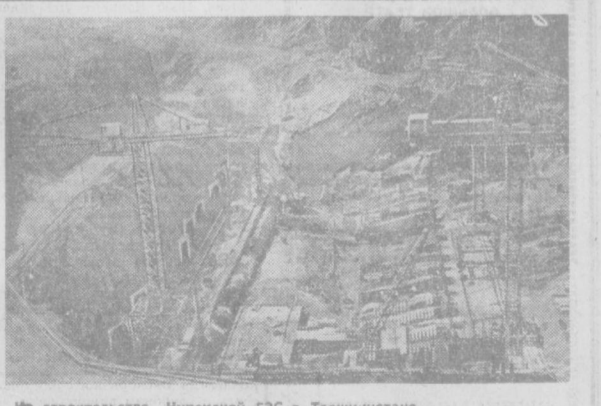
На строительстве Нурекской ГЭС в Таджикистане.

пите сушилку для столовой посуды, кастрюль, сковородок. Ведро для мусора, совок и ведро поставьте в шкаф, сделанный под мойкой. На внутренней стороне его двери можно сделать специальную подставку для ведра. Кухонные полотенца, тряпки (обязательно чистые) держите на специально прибитых рейках. Чаще всего в кухнях современных домов пол покрыт линолеумом. Такой пол не доставляет хозяевам много хлопот: подмочил под, протер влажной тряпкой — и разнотельный пол опрятен, как новый. Потерявший блеск линолеум «моют» теплой водой, но не горячей, без соли, затем дают ему просохнуть и покрывают тонким слоем мастики для пола. Освещение на кухне должно быть хорошим. Кроме общего освещения, повесьте над рабочим столом бра и, пожалуй, еще одно над раковиной. На окно повесьте занавески, гармонирующие по тону с цветной гаммой внешней кухни. Не забудьте и о цветах. Только не размещайте их на подоконниках.