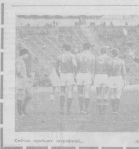
Сейчас пробуют штрафной...

ПРИЗ Федерации футбола СССР для клуба, набравшего наибольшую сумму очков основным и дублирующим составами, учрежден в 1958 году. Награды владельцы: 1958 г. — «Спартак» (Москва); 1959 г. — «Торпедо» (Москва); 1960 г. — «Динамо» (Киев); 1961, 1962 г. — «Спартак» (Москва); 1963 г. — «Динамо» (Москва); 1964 г. — «Динамо» (Тбилиси); 1965-1969 гг. — «Динамо» (Киев); 1970 г. — «Динамо» (Москва).