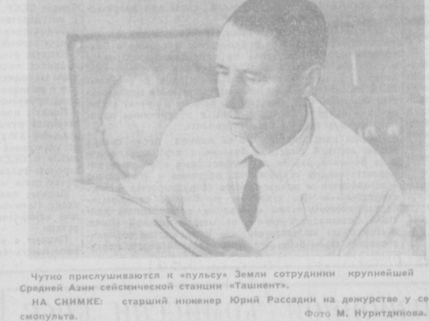
Чутко прислушивается к «пульсу» Земли сотрудник крупнейшей в Средней Азии сейсмической станции «Ташкент».

НА ЧЕБОКСАРСКОМ заводе «Текстильмаш» собраны бесчелюстные ткацкие станки, широко внедрение которых предусмотрено Директивой XXIV съезда КПСС. Новые машины в 2—3,5 раза производительнее члечюстных станков. Они упрощают технологический процесс, положительно влияют на условия труда, так как при работе производят значительно меньше шума, чем ныне действующее оборудование ткацких фабрик. (Корр. ТАСС).