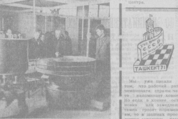
Много посетителей привлекает выставка оборудования пищевых и торговых предприятий Болгарии, размещавшаяся в зале ташкентского легкоатлетического манежа «Ешлик». НА СНИМКАХ: в залах выставки.

голев, Манши — Гуляев и Голосцев — Велоризки. В 16-м туре Андрейно выиграл у Абациева, Корхов у Машина, Мейринс у Шавеля, Дилев у Сабировского и Навалов у Зангиса. Вничью завершились партии Гуляев — Голосцев, Мицанский — Агафонов, Давыдов — Могилевский, Шеголев — Курьерман и Гайтварг — Вейдман. После 16 туров опереди Андрейно, набравший 11,5 очка из 15 возможных. На втором месте минский гроссмейстер Гайтварг. У него 10 очков из 15 проведенных встреч. С. ГУЛЯЕВ, мастер спорта СССР, озабочивать «Вечернего Ташкента».