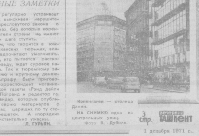
Копенгаген — столица Дании. НА СНИМКЕ: одна из центральных улиц. 3 стр. ВШЕНТ