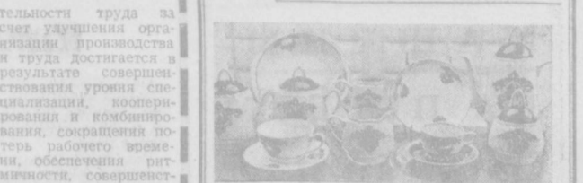
Ярмарка в Сокольниках

Наиболее распространенным способом измерения производительности труда является измерение ее в денежном выражении. В качестве объема продукции при исчислении производительности труда в денежном выражении принимается показатель валовой продукции. Для определения динамики производительности труда валовая продукция не-