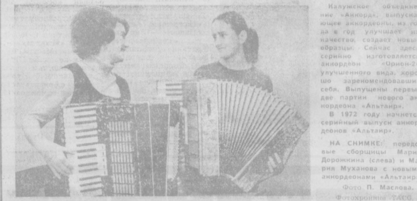
Калужские объединение «Анкорда»...