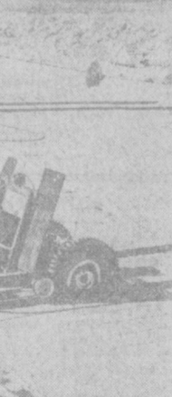
Вблизи Алмалина разведаны значительные запасы ценного строительного материала — известняка раннеюрского и распыловку богатств древнего моря помогли коллективу Алмалинского каменнообработывающего комбината специалисты Азербайджанского научно-исследовательского института «Промстройматериалов». С их помощью создан механизированный карьер, установлены мощные распиловочные станы.

Сегодня в Ташкенте переменная облачность, без осадков. Ветер восточный, 7-12 метров в секунду. Температура ночью 12-14, днем 18-20 градусов тепла.