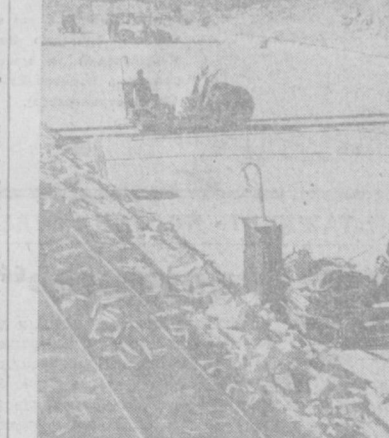
Вблизи Алмалина разведаны значительные запасы ценного строительного материала — известняка раннеюрского и распыловку богатств древнего моря помогли коллективу Алмалинского каменнообработывающего комбината специалисты Азербайджанского научно-исследовательского института «Промстройматериалов». С их помощью создан механизированный карьер, установлены мощные распиловочные станы.

Сегодня в Ташкенте переменная облачность, без осадков. Ветер восточный, 7-12 метров в секунду. Температура ночью 12-14, днем 18-20 градусов тепла.