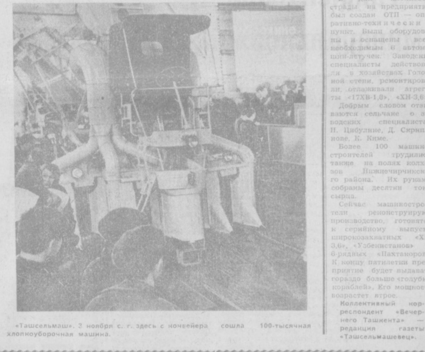
«Ташсельмаш». 2 ноября с. г. здесь с конвейера сошла 100-тысячная хлопкоуборочная машина.

В срадную хлопковую пору агитбригады клуба «Коммуналин» выступали с концертами на полевых станциях, на сенокосах, в Янгиюльском и Верхнеиринском районах на них присутствовало более десяти тысяч человек. Помимо этого, в колхозах и совхозах выпускались «молины», боевые листки. Наши юные моряки побывали в Сырдарьинской области. За хорошее обеспечение трудовых полей клуб получил грамоты. Давняя дружба связывает нас и с подшефным совхозом «Даматчи». Художники клуба оформили здесь немало стендов — «Страна плывет в коммунизм», «Решения XXIV съезда — в жизнь». С помощью фото-клуба оформлены Доска почета, стенд «Наши лучшие люди». Манеур Тухматаллиев показал в фототриптихе производственную деятельность рыбхоза. Теперь хотим создать здесь народный университет с двумя факультетами, помочь в организации школы коммунистического труда. На днях состоялся очередной выезд в шефам. На сей раз перед ними выступил их подполковник-юноша морехода. А на Новый год гости нашей экипажки будут и ребята из «Даматчи». Н. ХАЛЛИЛЮЛИН, директор клуба «Коммуналин».