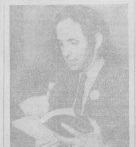
Американские газеты опубликовали секретные документы Пентагона о подготовке и развитии агрессивной войны США против вьетнамского народа. «Сделали плохое дело для страны». Об этом заявил доктор Д. Эллсберг, передавший эти документы в печать.