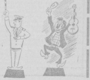
Днем и ночью... Рис. М. Воробейчикова.