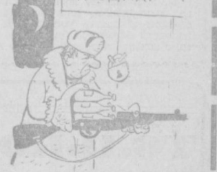
К ночному дежурству готова.