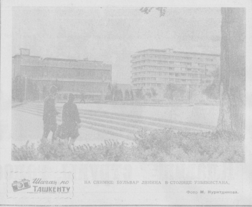
НА СНИМКЕ: БУЛЬВАР ЛЕНИНА В СТОЛИЦЕ УЗБЕКИСТАНА.

Телефоны редакции: коммутатор от 33-02-49 до 33-02-58; заместители редактора — 33-29-09, 33-29-33, ответственный секретарь — 33-57-02; отдел партийных, советских и профсоюзных организаций, городского хозяйства — 33-29-42; отдел промышленности и строительства — 33-08-74; отдел литературы и искусства — 33-29-55; отдел писем и массовой работы, спорта — 33-29-70; отдел науки, вузов и школ, иллюстрации — 33-58-87; отдел информации — 33-28-95; отдел объявлений — 33-81-42.