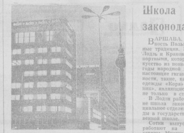
БЕРЛИН. В этом красивом здании, расположенном в самом центре столицы ГДР, несколько месяцев назад справили новоселье. Здесь разместилось информационное агентство республики — АПН.

В связи с увеличением промышленного строительства расширяется и горноуральная промышленность. Ко времени вступления в строй завода в Титово-Велесе закончатся модернизация свинцово-цинковых рудников в Злетово, после чего они будут давать ежегодно свыше миллиона тонн руды.