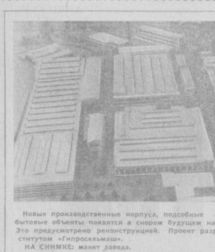
Новые производственные корпуса, подсобные помещения, культурно-бытовые объекты появятся в скором будущем на заводе «Ташсельмаш». Это предусмотрено реконструкцией. Проект разработан проектным институтом «Ташсельмаш». НА СНИМКЕ: маневр завода.