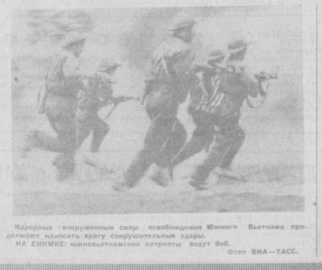
Народные вооруженные силы освобождения Южного Вьетнама продолжают наносить врагу сокрушительные удары. НА СНИМКЕ: южновьетнамские патриоты ведут бой.

Крепкая дружба связывает коллектив треста «Строймеханизация» Глазташентстрой с тулганским совхозом имени Крупской. По просьбе хлопкоробов ташкентские механизаторы передали курс обучения по вождению тракторов, бульдозеров и других механизмов. С первых дней уборки сырья в Гулистанском районе действовала наша передвижная авторемонтная станция. Кроме того, группа слесарей треста продолжительное время работала на Гулистанском хлопкоперерабатывающем заводе, помогая службе главного механика в ремонте хлопкоочистительной техники. — Накануне хлопковой страды, — говорит секретарь парткома треста Ю. Калмыков, — к нам приехало много механизаторов. Они прошли на месте курс обучения по вождению тракторов, бульдозеров и других механизмов. С первых дней