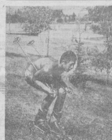
ЮГОСЛАВИЯ. Вот так лихо натают на горы на роляхных лыжах белградские студенты. Они остаются верны зимнему спорту, правда, чуть видоизмененному, даже в дни жаркого лета.

ЛАГОС. Крупным событием в культурной жизни Нигерии стало создание первой на севере страны постоянной театральной труппы при университете имени Ахмаду Белло.