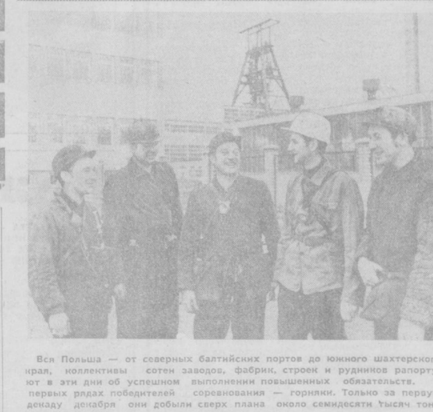
Вся Польша — от северных балтийских портов до южного шахтерского края, коллективы сотен заводов, фабрик, строен и рудников рапортуя в эти дни об успешном выполнении повышенных обязательств.

▲ КАРАЧИ, 26. Издающийся в Карачи журнал «Морнинг Ньюс» пишет: Бхутто, не теряя ни одной минуты, должен начать предварительные переговоры с Рахманом и договориться с ним о политическом урегулировании.