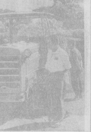
НА СНИМКЕ: у советского трактора.

Хищение произведений искусства в Италии стало своего рода «промыслом» многочисленных воров. Несмотря на строгие меры, принимаемые со стороны властей по охране художественных ценностей, разграбление картинных галерей, церквей и частных собраний возрастает.